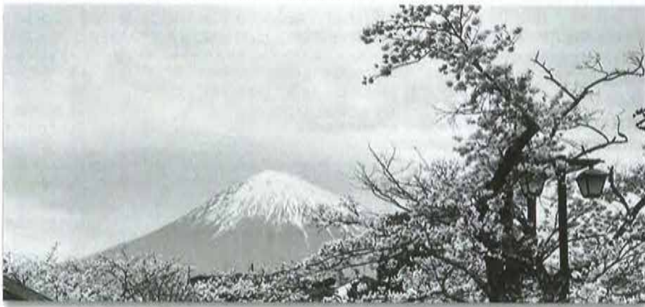
写真:桜と富士山(富士山本宮浅間神社にて 令和5年3月31日)

バランスのとれた食事と適度な運動・睡眠に気をつけ、不摂生を正し、規則正しく生活するのが基本です。当たり前のことかもしれませんが、当たり前のことが意外と難しく大切なものだと思います。